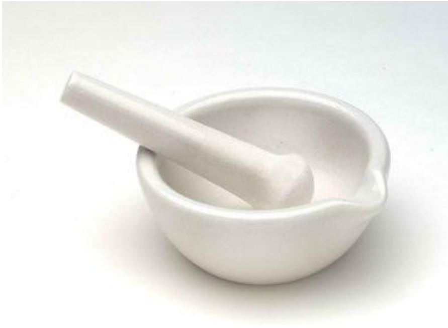
Εικόνα 5 Γουδί με γουδοχέρι