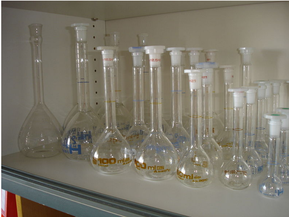
Εικόνα 3 Ογκομετρική φιάλη