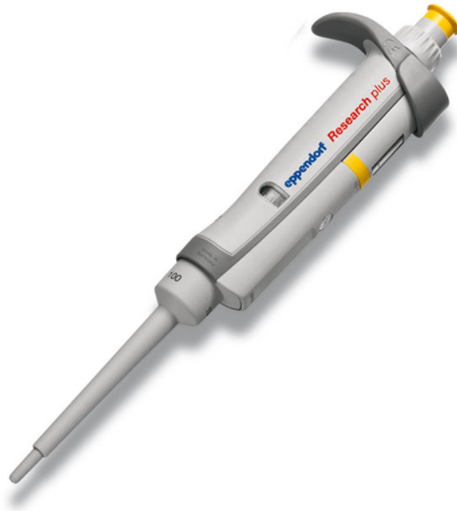
Εικόνα 10 Μικροσιφώνιο