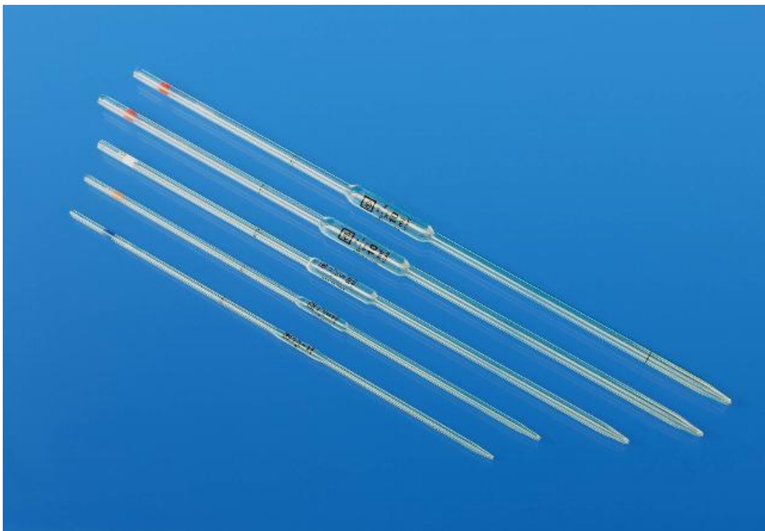
Εικόνα 8 Σιφώνια πλήρωσης