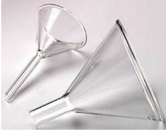
Εικόνα 9 Χωνιά εργαστηρίου