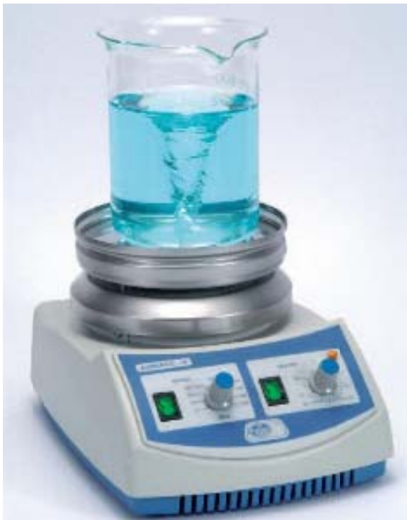
Εικόνα 12 μαγνητικός αναδευτήρας