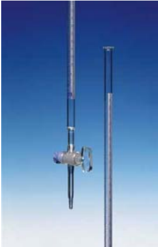
Εικόνα 11 Προχοΐδα