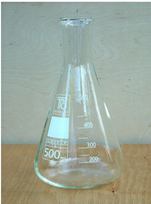
Εικόνα 2 Κωνική φιάλη