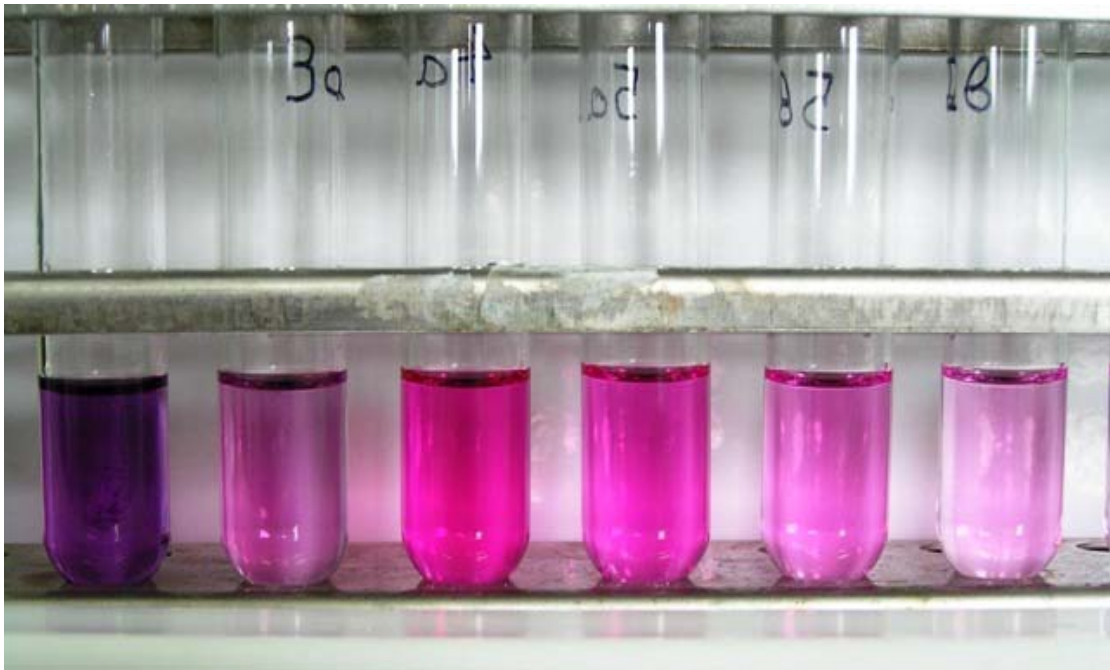
Εικόνα 6 Δοκιμαστικοί σωλήνες